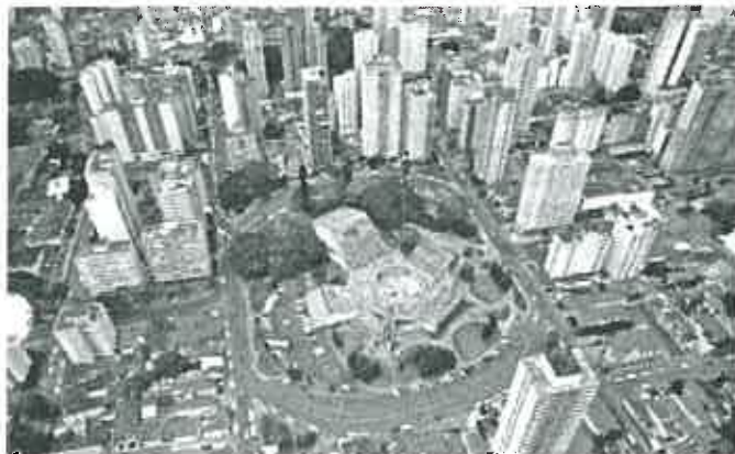
Vista aérea do Centro de Convivência Cultural - Campinas

Atendendo determinação da Assembléia Geral Ordinária de 1999, o VII Encontro Brasileiro de Higienistas Ocupacionais acontecerá no Estado de São Paulo. Se você não conhece, vai se surpreender com Campinas, cidade de quase um milhão de habitantes, e que está a apenas 80 km (60 minutos) da capital.